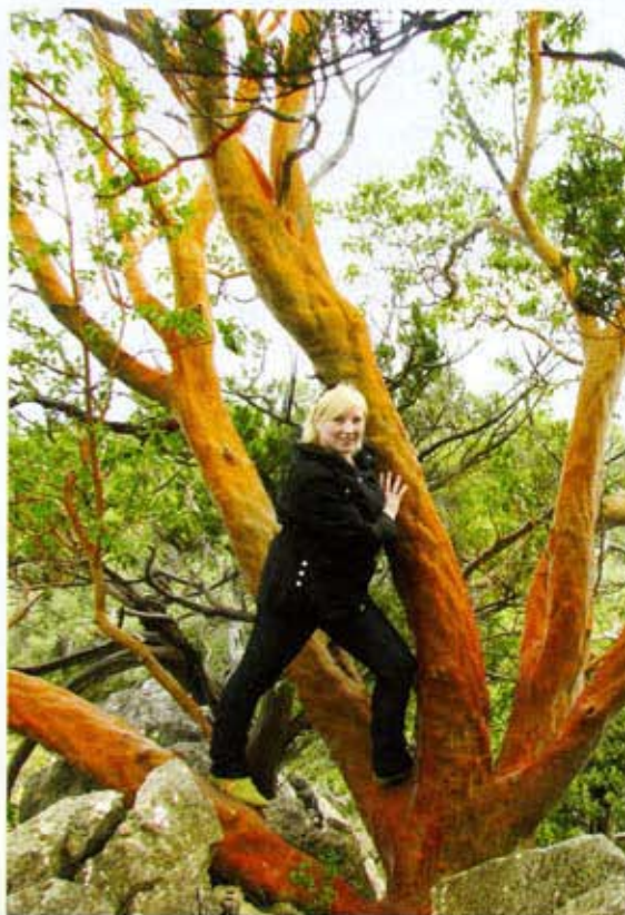
КРАСНЫЙ ЗЕМЛЯНИЧНИК ▲

Из Симферополя мигрируем в поселок Никита, где будем проживать ближайшие пару дней. Только прибыв на место, мгновенно погружаемся в волны золотого цветения лавров и белоглоубого – розмаринов, и без промедлений отправляемся изучать почти дикую местность – окрестности поселения Никита – склоны горы Ай-Илья. Изредка встречаем наземные орхидеи, мохнатые живучки, желтые первоцветы. Выходим. На склонах будто бы загорелые тела разминающихся атлетов – стволы земляничных деревьев, с очень