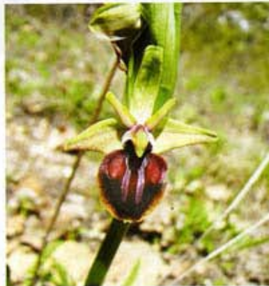
▶ ОРХИДЕЯ ОФРИС ПЧЕЛОНОСНАЯ