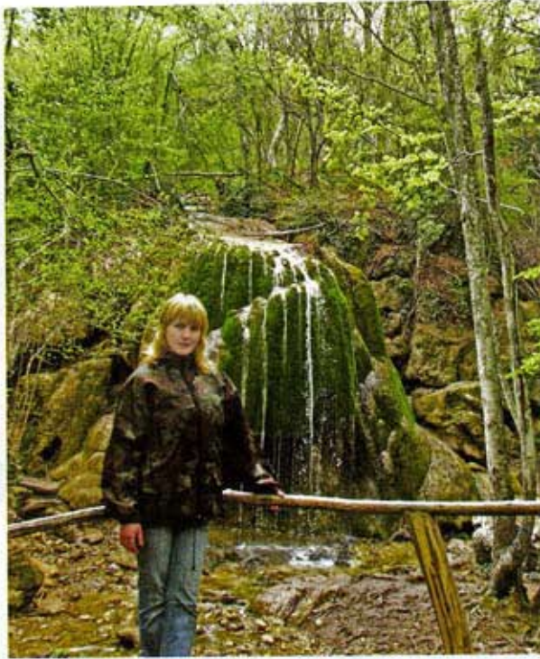
▲ ГОРНЫЙ РУЧЕЙ

А ночи здесь достаточно холодные, хотя и юг, поэтому спим по системе «Сэндвич» – матрас внизу, далее тело путешественника, и сверху ещё один матрас. Одеяла без надобности.